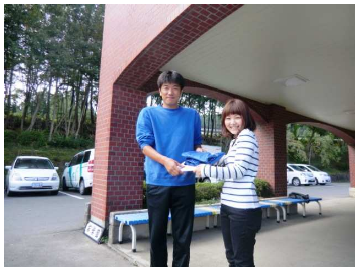
若葉園・赤松管理者に感謝の色紙を渡しました。

たくさんの方々のご協力のもとで北部支援センターでの支援活動を継続することができました。みなさん本当にありがとうございました。