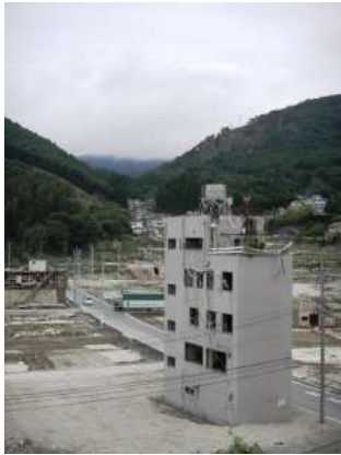
道路整備が進む女川町

半年以上の月日が流れ、やっと JDF の支援員として志願しようという前向きな気持ちになることが 出来ました。それは私が何も出来なかった期間を、また震災直後の混乱した中を、スタッフとして現地 入りした全国の支援員たちの、地道で弛まぬ活動が被災障がい者、そして私をも支えてくれたからです。 頑張れないときはいいんだよ。それまでは任せていいんだよ。そういう気持ちに包まれ、鋭気を養い、 そして「震災」によってもたらされた様々な出来事に正面から向き合い始める ことが出来るようになったのだと思います。