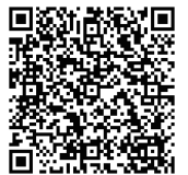
デージー図書再生動画