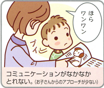
コミュニケーションがなかなかとれない。(お子さんからのアプローチが少ない)