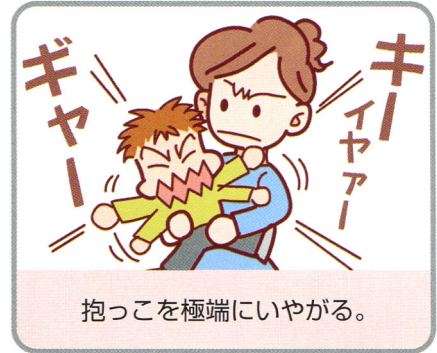
抱っこを極端にいやがる。