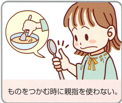
ものをつかむ時に親指を使わない。