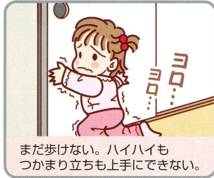
まだ歩けない。ハイハイもつかまり立ちも上手にできない。