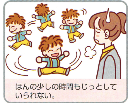
ほんの少しの時間もじっとしてられない。