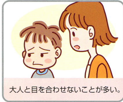
大人と目を合わせないことが多い。