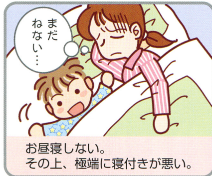
お昼寝しない。その上、極端に寝付きが悪い。