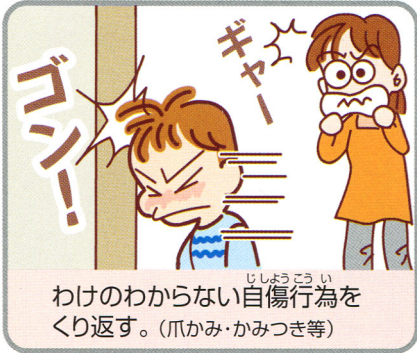
わけのわからない ししょうごうい 自傷行為を繰り返す。(爪かみ・かみつき等)